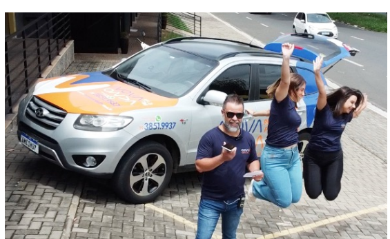
Pontos estratégicos de grande circulação