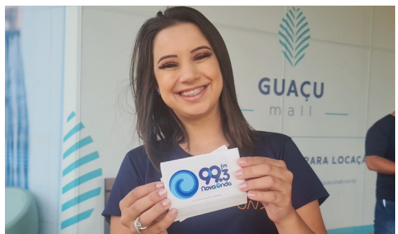
Interação com público passantes